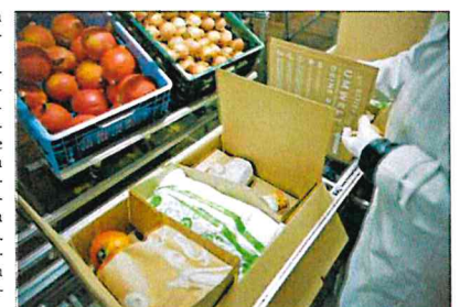
Am neuen Standort in Barleben werden die Kochboxen von Hellofresh voraussichtlich ab Ende 2022 verpackt und verschickt.

Hellofresh, tätig in 14 Ländern, ist nach eigenen Angaben der weltweit führende Anbieter für Kochboxen. Die werden im Abo-Modell inklusive Rezept und mit abgemessenen Zutaten an die Haustür geliefert. Im ersten Quartal 2021 seien mehr als 239 Millionen Mahlzeiten zugestellt worden. Weltweit hat das Unternehmen nach eigenen Angaben rund 7,3 Millionen aktive Kunden. Hellofresh war im November 2017 in Frankfurt an die Börse gegangen.